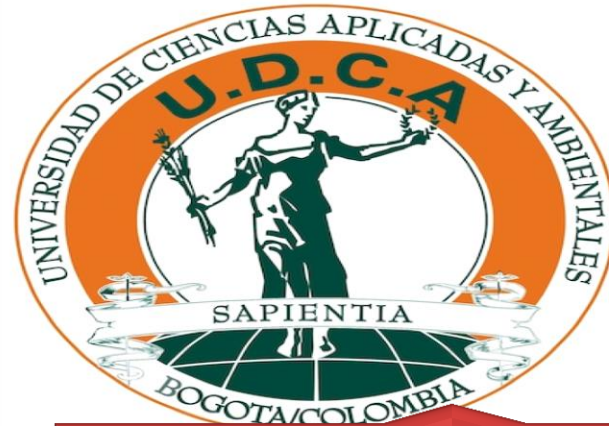
Universidad de Ciencias Aplicadas y Ambientales UDCA