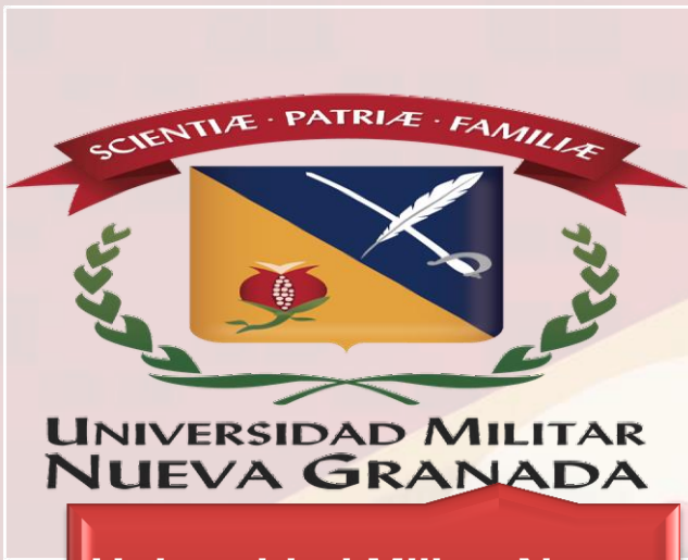
Universidad Militar Nueva Granada UMNG